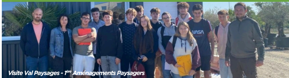
Visite Val Paysages - 1 ère Aménagements Paysagers

Au lycée, en apprentissage ou en formation adulte, trois voies pour construire son projet professionnel dans le paysage :