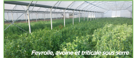
Fevrolle, avoine et triticale sous serre

Le maraîchage de Naturapolis inclut aujourd'hui près de 30 espèces et une quarantaine de variétés : pommes de terre, radis, courges, poireaux, choux, patates douces, betteraves, panais... Les apprenants testent différentes méthodes culturales afin de comprendre ce qui fonctionne dans un atelier maraîcher bio et qui soit économiquement viable. L'objectif est de leur transmettre les compétences techniques essentielles tout en sensibilisant à la biodiversité et à la production durable. Au-delà de l'apprentissage pratique, ce projet montre aux étudiants qu'il est possible de combiner formation, production alimentaire et engagement écologique, tout en préparant des débouchés professionnels dans le maraîchage et l'horticulture.